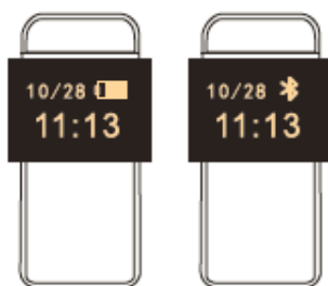
Data y hora